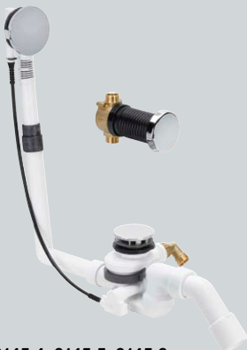
Modely 6145.4, 6145.5, 6145.6